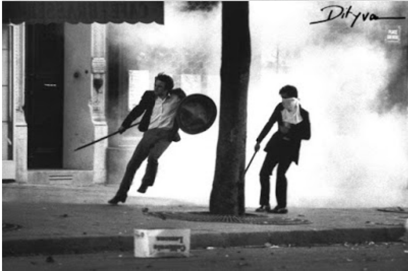
Los estudiantes en acción, París, mayo 1968