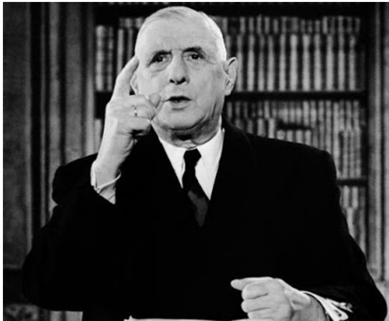
Charles de Gaulle, como presidente de Francia

El PCF comprendía, al igual que en el caso italiano, que Francia sólo disponía en aquella época de una soberanía limitada, y que Estados Unidos jamás concedería a un gobierno izquierdista los beneficios del Plan Marshall de reconstrucción económica que tanto necesitaba el país.