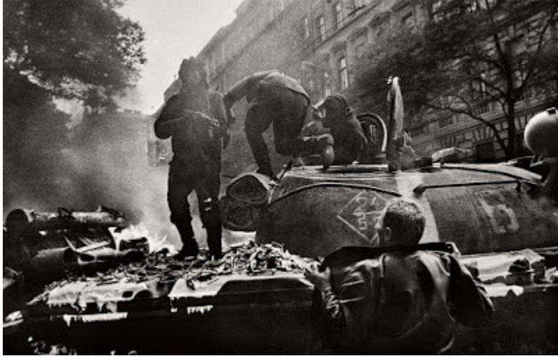
Las calles de Praga en agosto de 1968 bajo la vigilancia de las tropas del Pacto de Varsovia.

También en septiembre del 68 el movimiento feminista interrumpía en los escenarios, el movimiento de liberación de la mujer exigió independencia y reconocimiento a la igualdad con los hombres.