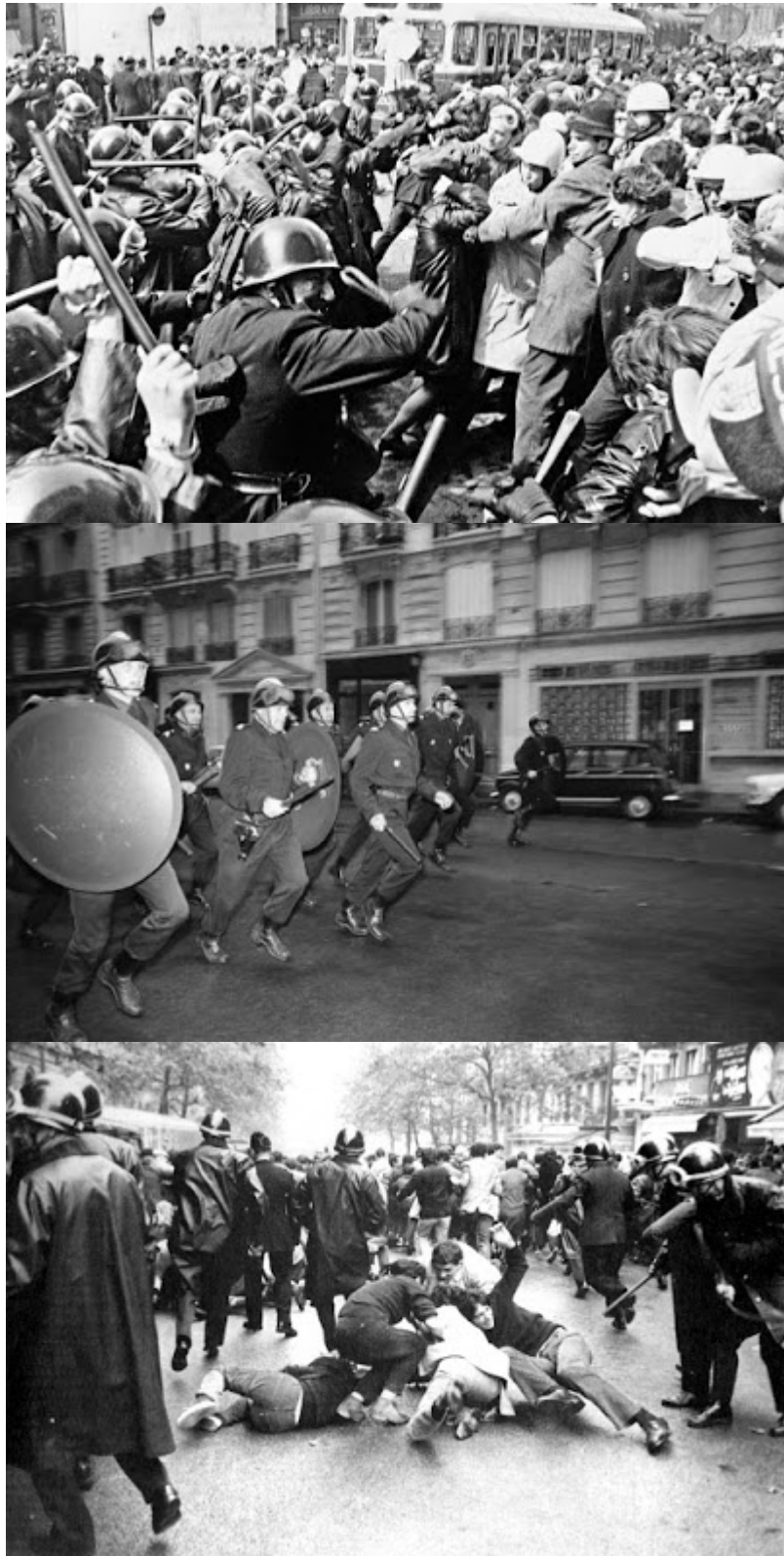
Algunas secuencias fotográficas de los CRS en acción. Compagnies Républicaines de Sécurité (Compañías Republicanas de Seguridad), fuerzas de seguridad de la Policía Nacional.

La revolución no llegó a darse, pero estuvo a punto de terminar con el poder de un ícono francés, Charles de Gaulle. Las secuelas fueron inmensas, de Gaulle tuvo que salir de Francia