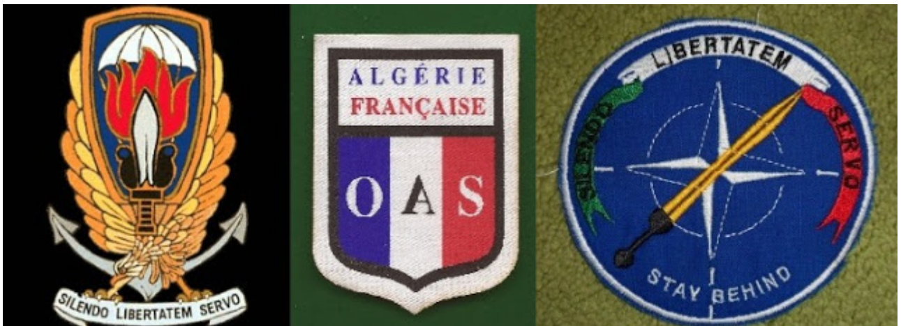
Gladio, OAS, son algunas unidades relacionadas con la red Stay Behind de la OTAN

Como hemos dicho al inicio, no es posible entender "Mayo 68" sin esta larga explicación de la historia francesa de posguerra (y de Europa Occidental), era una lucha existencial entre el capitalismo y el comunismo, una época en que el comunismo pudo haber triunfando, en las urnas o mediante una revolución. "Mayo 68" contaba en su liderazgo con gente que sufrió los horrores de la segunda guerra mundial y la resistencia antifascista, se sumaron la juventud estudiantil y los obreros nacidos en la primera generación de posguerra, por ello contaron con fuerte apoyo popular que ocasionó un tremendo susto a las élites oligárquicas.